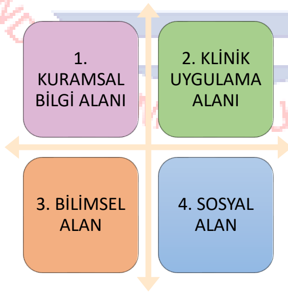
Şekil 1. ÖGM temel alanları

Portfolyo dosyası kişisel ve profesyonel gelişimin değerlendirilmesinde karşılanması gereken dört temel alanı kapsamaktadır. Bu alanlar kuramsal bilgi alanı, klinik/saha uygulama alanı (işletmelerde yaptıkları eğitim uygulamaları), bilimsel alan ve sosyal alandır. (Şekil 1). Öğrencinin dört temel alandaki gelişimin değerlendirildiği bu yapının adı “Öğrenci Gelişim Modeli-ÖGM”dir. Hemşirelik Bölümü öğretim elemanları, insanların algı ve yönelimlerinin farklı olduğu, gerçeği kendisine göre anlamlandırıldığı inancıyla öğrencinin her bir alanda aynı gelişimi gösteremeyeceğini kabul etmektedir. ÖGM ile başarılmak istenen öğrencilerin ilgi duydukları alanlarda daha fazla gelişim göstermesini kabul ederek, tüm alanlarda asgari gelişimin (60 puan ve üzeri) başarılmasıdır.